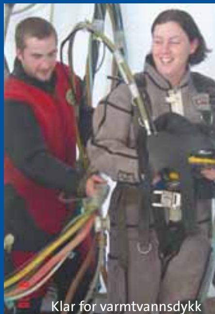
Klar for varmtvannsdykk