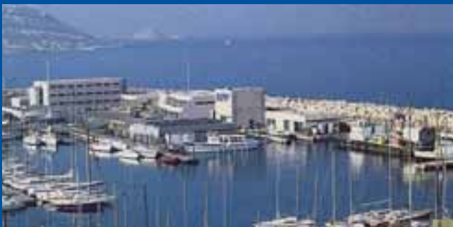
INPPs skoleanlegg ved Port de la Pointe Rouge utenfor Marseille